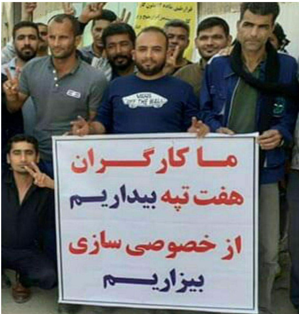
ویژه سندیکای کارگران هفت تپه!